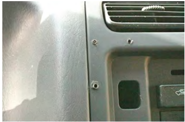
Wanneer er duidelijke schroefgaten zichtbaar zijn in het bestuurdersof passagiersgedeelte.