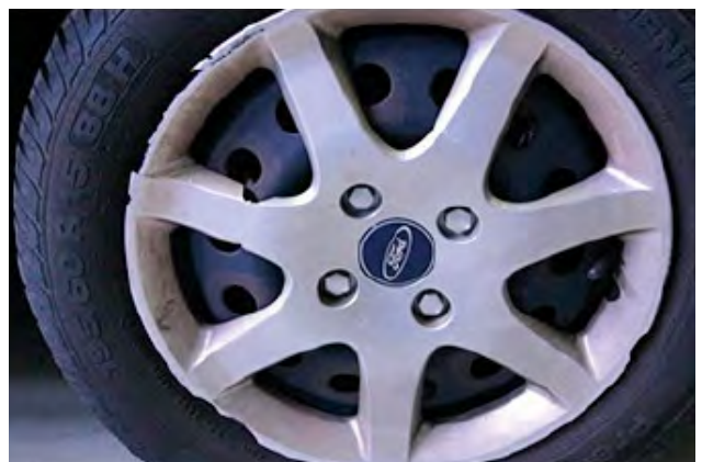
Scheuren in wioldoppen of ontbrekende onderdelen van wioldoppen.