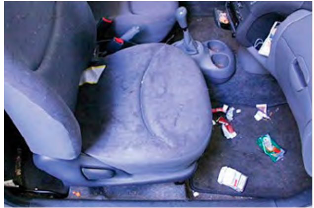
Wanneer het oppervlakkige vuil niet door normale reiniging schoongemaakt kan worden.