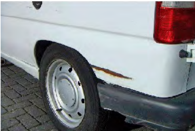
Deuken, butsen of krassen waarbij de laklaag zodanig is beschadigd dat er zichtbare roestplekken ontstaan.