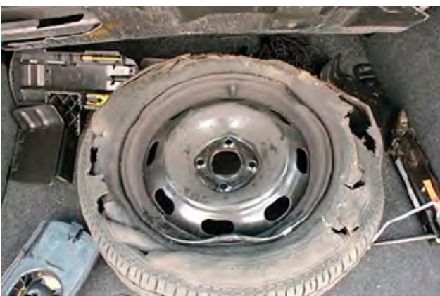
Beschadiging aan de band zoals scheuren, barsten, gaten of banden met onvoldoende luchtdruk als gevolg van een lek.