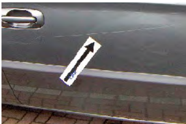
Krassen die langer zijn dan 10cm en niet meer te polijsten zijn.