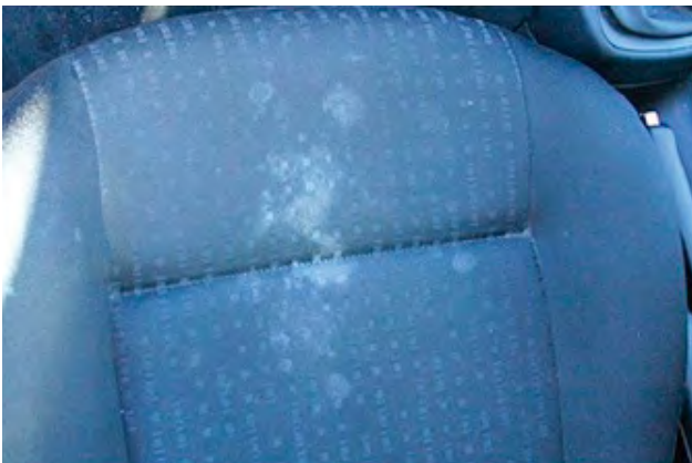
Vlekken die niet d.m.v. een normale reiniging kunnen worden verwijderd.