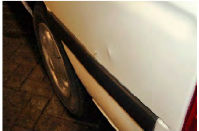
Beschadiging van binnenuit ontstaan door het onvoldoende vastzetten van een lading.