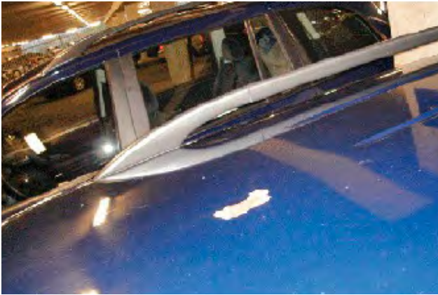
Aantasting van de lak door een van buiten komend onheil.