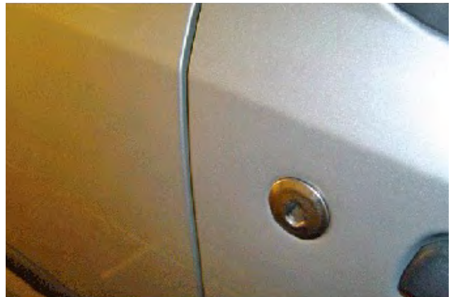
Schade die ontstaan is als gevolg van inbraakschade.