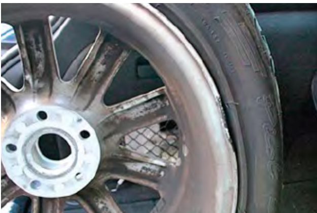
Zware beschadigingen (vervorming) aan de velgen of ontbrekende delen.