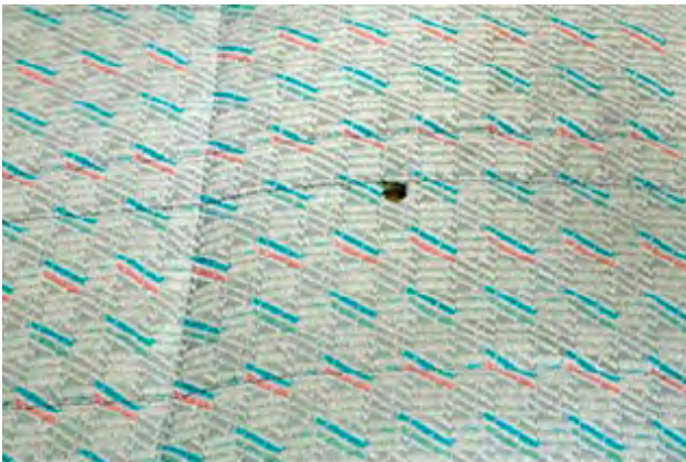
De bekleding vertoont schroeiplekken of gaten.