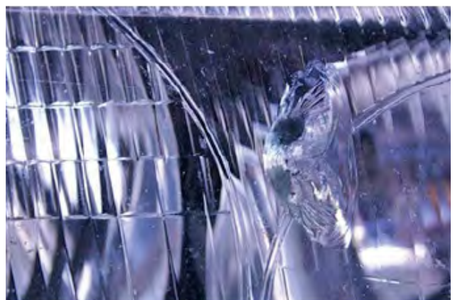
Wanneer er een duidelijk gat in de koplamp, mistlamp of richtingaanwijzer zit.