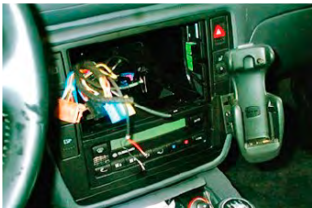
Origineel gedemonteerde onderdelen, zoals bijv. radio's of navigatiesystemen.