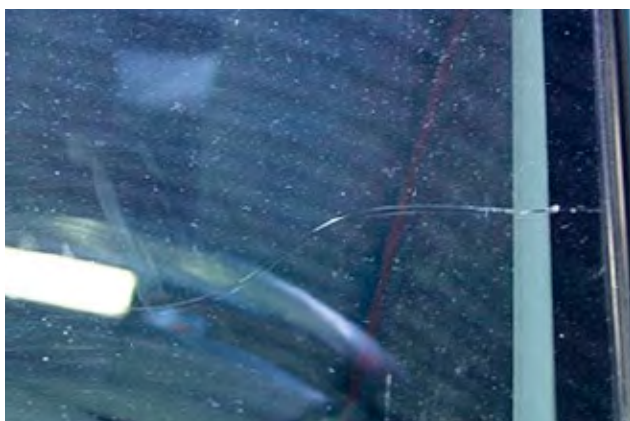
Scheur(en) op ruiten die ontstaan zijn door steenslag.