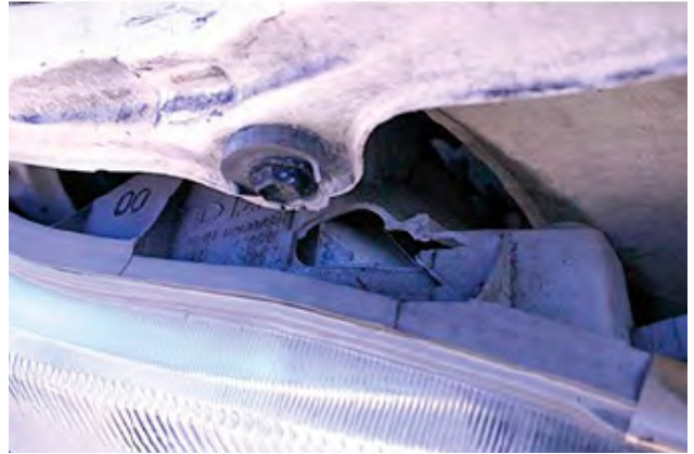
Als de koplamphuis beschadigd is.