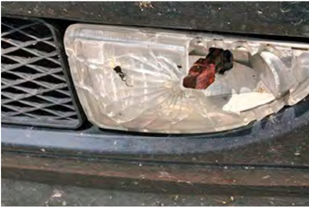
Wanneer het glas van een mistlamp gebroken is.