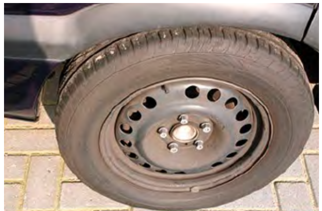
Wanneer er 1 of meerdere wieldeksels ontbreken.