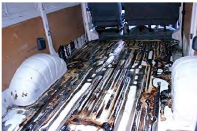
Wanneer door vloeistoffen de laadruimte is aangetast.