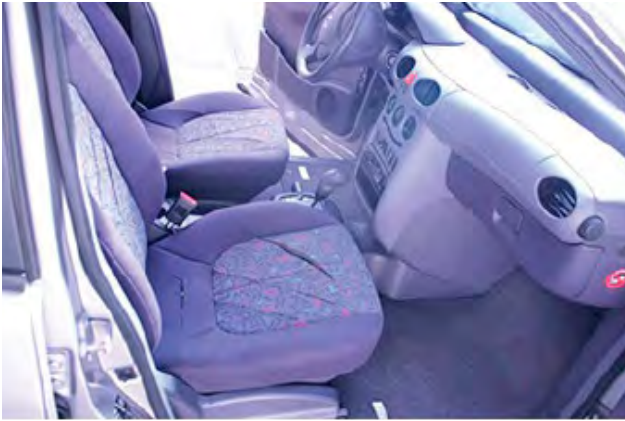
De bekleding vertoont materiaalscheuren of is bij de naden uitgescheurd.