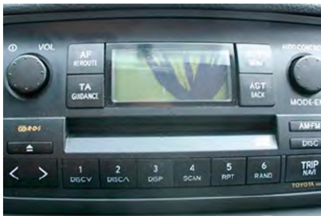
Originele onderdelen die beschadigd zijn.