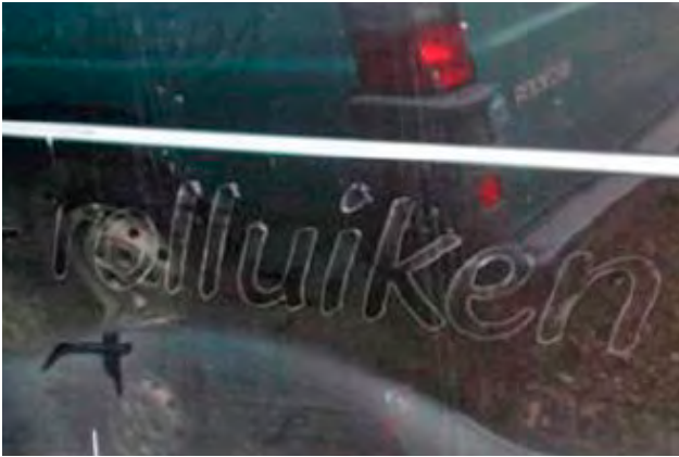
Wanneer er een verkleuring van de lak zichtbaar is na het verwijderen van de reclame.