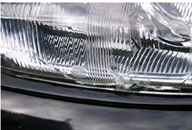
Steenslag op de koplampen, mistlampen of richtingaanwijzers waarbij er sprake is van een breuk van het glas.