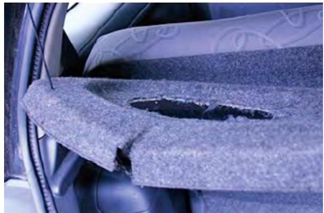
Wanneer er gaten in de hoedenplank voor speakers zijn gemaakt.