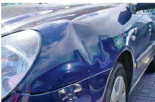
Beschadigingen groter dan 24mm. (1 euro muntstuk)