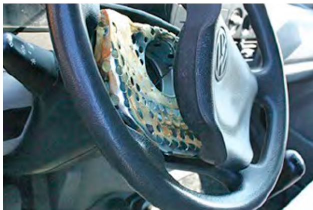
Wanneer er onderdelen vernield zijn.