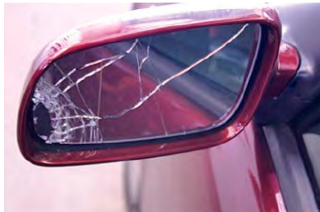
Vervormingen of kapotte spiegels en beschadigingen van meer dan 50mm lang en die door de laklaag heendringen.